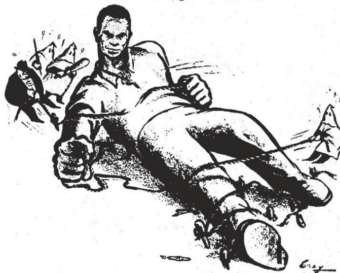
Freedom is Rising in the South