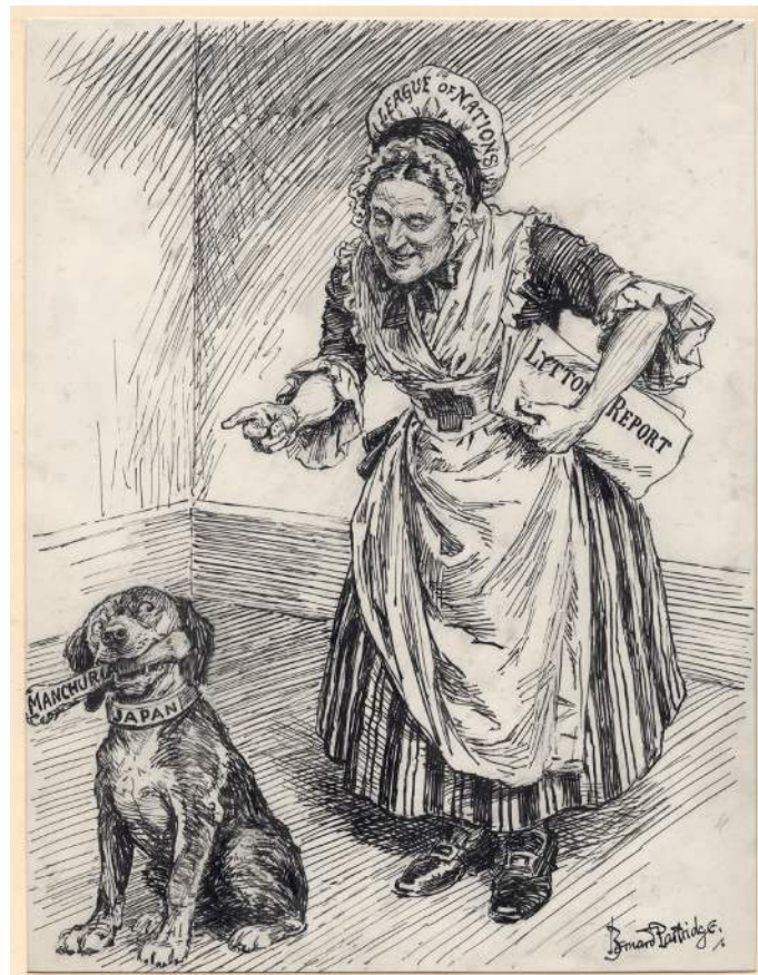
[Quelle: Bernard Partridge, The Command Courteous, © National Portrait Gallery, London, http://www.npg.org.uk/collections/search/use-this-image.php?mkey=mw43528 ]

Quelle L Bernard Partridge, Karikaturist, stellt die Reaktion des Völkerbundes auf die Mandschurei-Krise in der Karikatur „The Command Courteous“ (Der höfliche Befehl) für die britische Zeitschrift Punch dar (12. Oktober 1932). Auf der Mütze der Frau steht „Völkerbund“, auf der Zeitung „Lytton-Bericht“, auf dem Hund „Japan“ und auf dem Knochen „Mandschurei“. Die Unterschrift lautet „Völkerbund: ‚Guter Hund — aus!‘“.